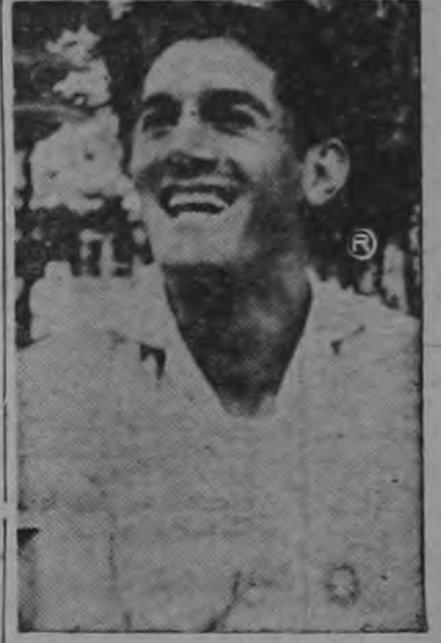
Alegría ante la oportunidad que le brinda El Carmen

—Quiero darle las gracias por brindarme la oportunidad de aclarar definitivamente mi situación, lo que ha sucedido y lo que sucedió en la gira. Yo creo que los fanáticos, mis amigos y en fin quienes se interesan por las cosas del fútbol, merecen esta explicación que no tiene la intención de