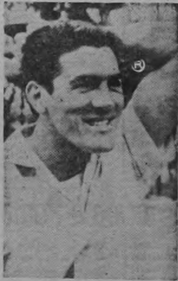
Recordando incidentes en las gramillas del mundo

—Por cierto que no quería. Yo lo había dicho. Tenía a mi novia enferma, grave, a mi padre igualmente enfermo y no tenía permiso en mi trabajo. Yo pedí para ir, una cantidad de dinero y nada se me resolvió, no fue sino cuando ya se iba a ir el equipo que llegaron a sacarme de mi casa y a la "carrera" me alisté para irlos, habiéndoles indicado que aún así no tenía intención de viajar por los problemas que tenía. Allos dirigentes de la Li