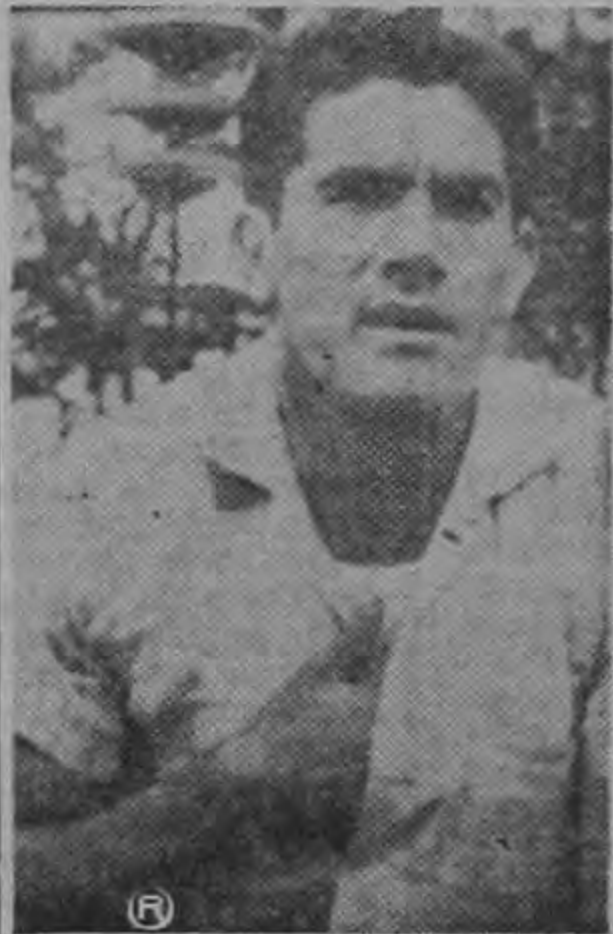
Si voy a jugar a México será muy bien contratado

—Ah, es que no jugué contra el Saprissa. Yo considero que hizo muy mal la Directiva