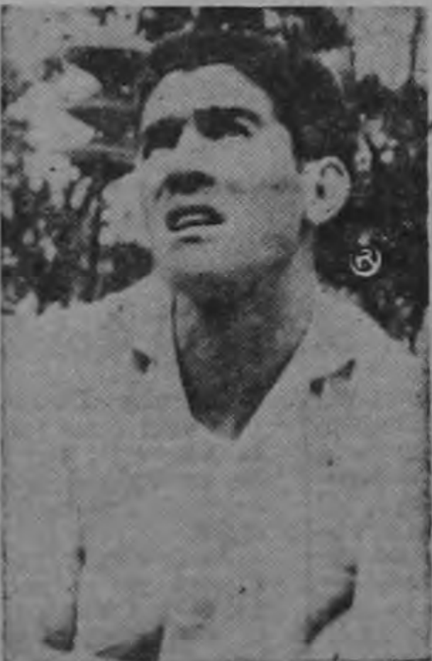
Desilusionado con los directores del Alajuelense

—Se me hizo entrenar con equipo prestado, incluyendo los zapatos que eran número cuarenta y uno, por lo que me que daban nadando.